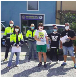
I ragazzi con i volontari nella sede della Protezione Civile