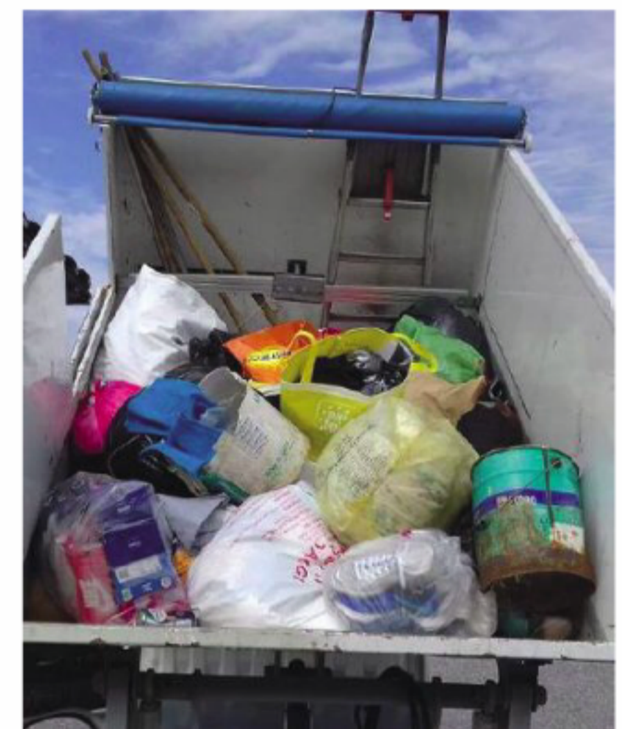
I rifiuti trovati nei cassonetti gialli per gli abiti usati