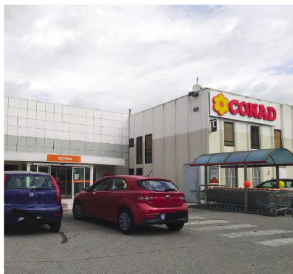
La nuova insegna Conad in via Emengarda